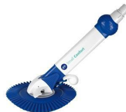
Automatischer Bodenreiniger Automatic cleaner AR20682