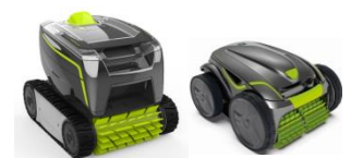
Roboter Robot GT3220/GV3420