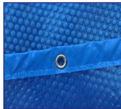
CVKPCOR60 Isothermabdeckplane Isothermic cover