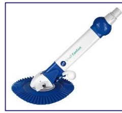
Automatischer Bodenreiniger Automatic cleaner