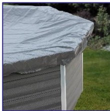
CIKPCOR60 Winterabdeckplane Winter cover